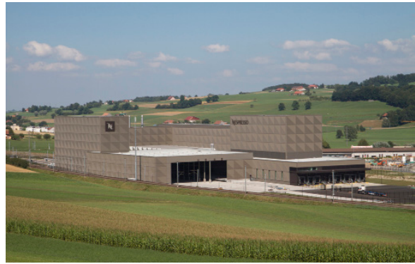
Nespresso, Romont Heizungs- und Kälteanlagen.