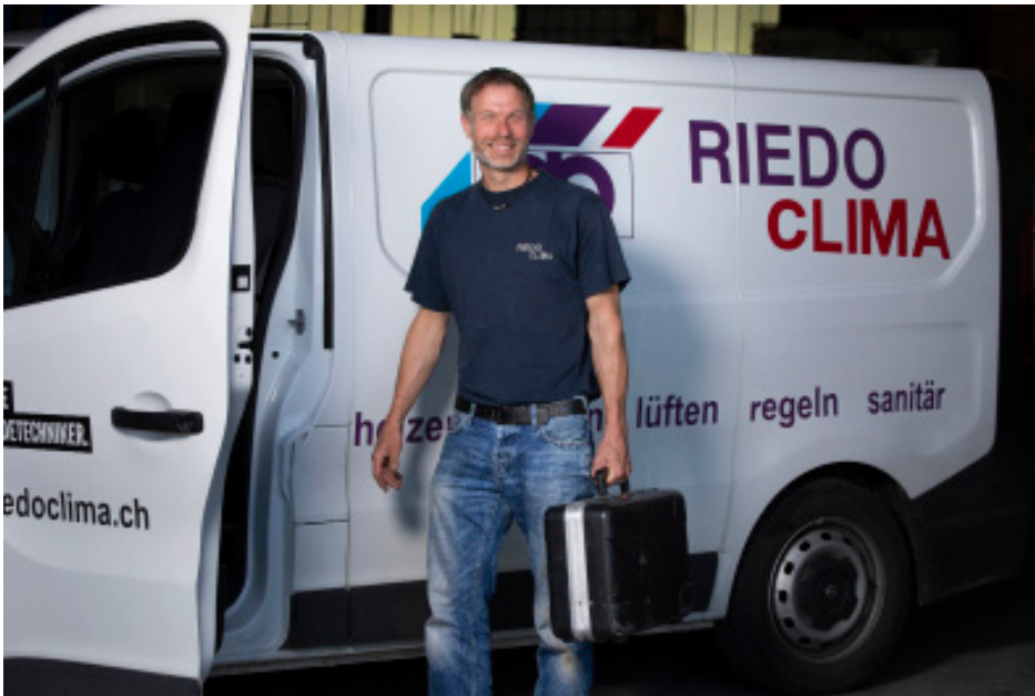
Bereit für jeden Einsatz!