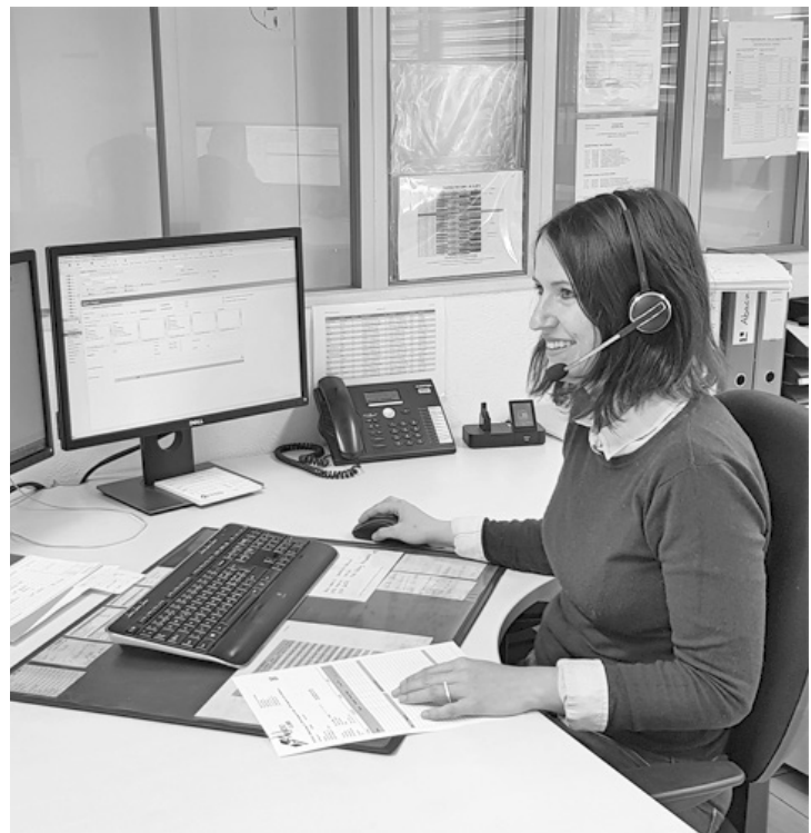
... in deutscher und französischer Sprache