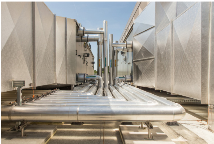
Nespresso SA, Romont Installations de chauffage et froid, ainsi que ventilation, monoblocs sur toiture