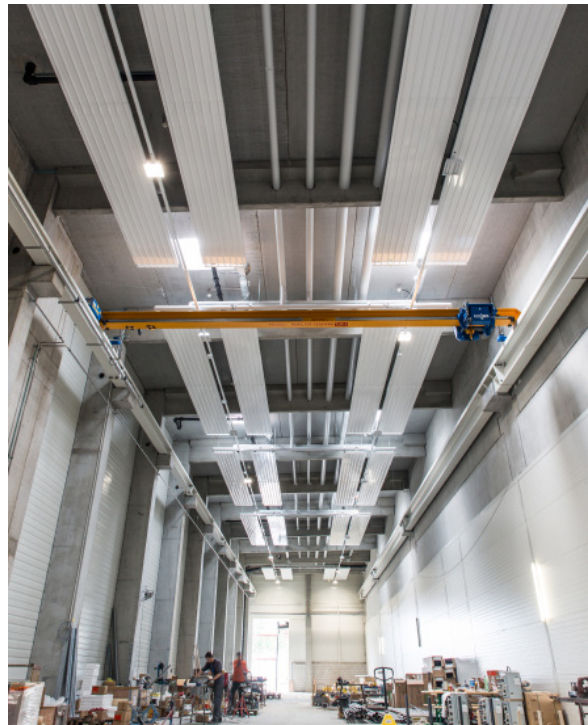
Liebherr Machines SA, Bulle Inst. vapeur, chauffage et froid / Panneaux rayonnants de plafond