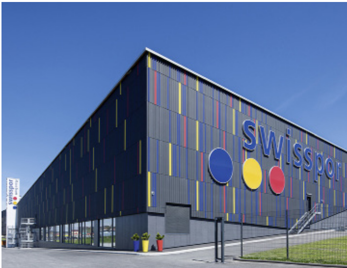
Swisspor I und II, Châtel-St-Denis Système vapeur et installation de chauffage